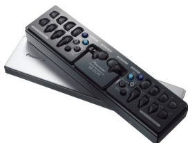
<アルミ製蓋付収納ケース>