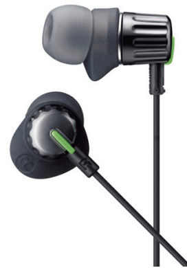
密閉型バランスド・アーマチュア型 ステレオヘッドホン