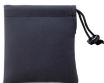
<キャリングポーチ>