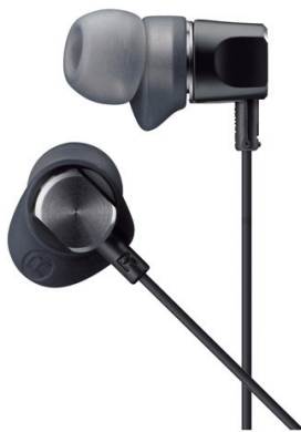
密閉型バランスド・アーマチュア型 ステレオヘッドホン