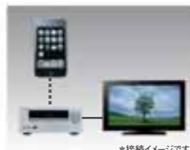
*接続イメージです。

iPodに保存した動画やスライドショーを、テレビなどのモニターへ出力することができます。思い出の写真を見ながら、その時流れていた楽曲を同時に再生するなど、自由な発想で楽しむことができます。