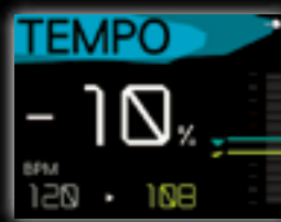
▲テンポコントロール設定画面