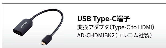
USB Type-C端子 変換アダプタ (Type-C to HDMI) AD-CHDMIBK2 (エレコム社製)