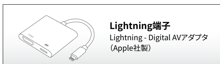
Lightning端子 Lightning - Digital AVアダプタ (Apple社製)